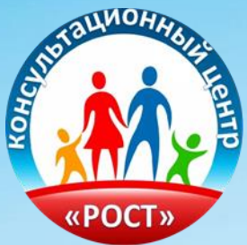
График работы специалистов консультационного центра «РОСТ»